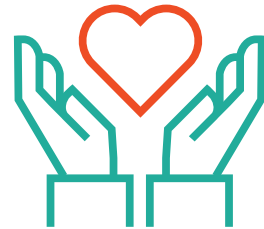
Foglalkoztatás és esélyegyenlőség